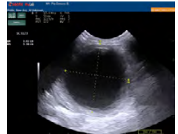
Figura 1. Diámetro quiste.

aparentemente adherido a un segmento del yeyuno (Figura 2).