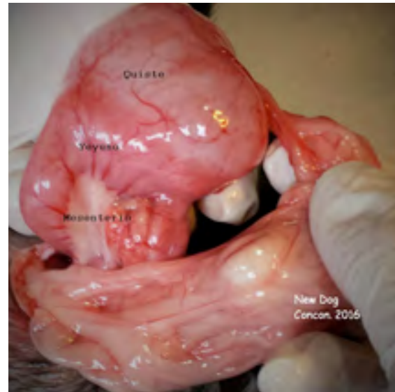
Figura 3. Duplicación intestinal.