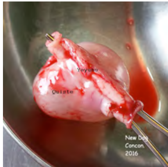
Figura 4. Segmento intestinal removido.