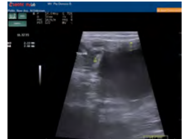
Figura 2. Diámetro pared quiste.

Laparotomía exploratoria identifica una masa de origen quístico en la superficie del mesenterio de lado izquierdo del abdomen adherida a la pared muscular del yeyuno, compartiendo el suministro de sangre (Figura 3). Al remover la masa y realizar un estudio macroscópico del corte longitudinal de yeyuno, no encontramos una comunicación entre el lumen intestinal y la masa quística. Tampoco se presentan signos de perforación, hemorragia o inflamación (Figura 4). La masa quística presenta una superficie lisa con contenido líquido que al seccionarla deja ver una superficie interna lisa y brillante que contiene un exudado parecido a mucus (Figura 5).