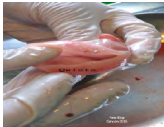
Figura 5. Incisión quiste.